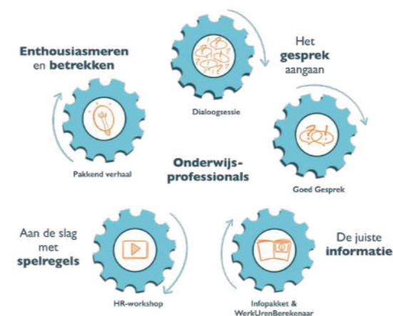
Figuur 2: de HPP-veranderaanpak in het primair onderwijs