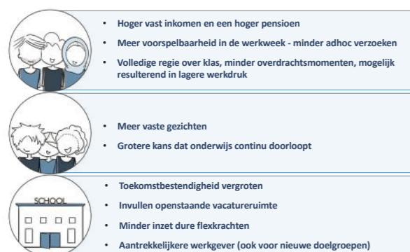
Figuur 1. Voordelen van grotere aanstellingen

Eén van de mogelijke oplossingen die vaak nog onderbelicht blijft is urenuitbreiding bij bestaande onderwijsprofessionals. Meer dan de helft van de leerkrachten en het onderwijsondersteunend personeel werkt namelijk in deeltijd. Als een deel van alle onderwijsprofessionals, met al hun kennis en ervaring, een halve of een hele dag per week meer zou gaan werken, zou dat een groot verschil maken. Niet alleen bij het adresseren van tekorten, maar ook voor leerlingen, onderwijsprofessionals, scholen en schoolbesturen.