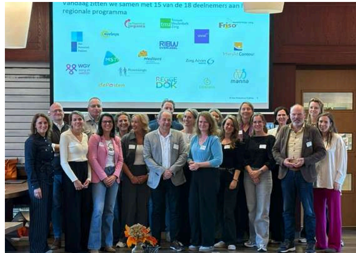
Startbijeenkomst in september 2025

Organisaties trekken hierin samen op en delen kennis en ervaringen. Ook worden alle interventies, materialen en geleerde lessen vastgelegd en beschikbaar gesteld aan alle zorg- en welzijnsorganisaties in de regio zodat wordt gebouwd aan een regionaal lerend netwerk. Samen werken zij toe naar een toekomstbestendigere arbeidsmarkt voor de Twentse zorg- en welzijnssector.