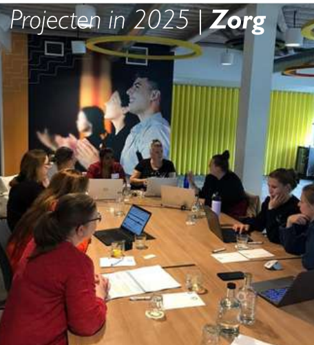
Projecten in 2025 | Zorg